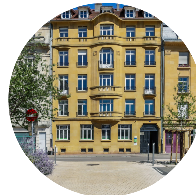
Siège social groupe Quadral 3 place du Roi George à Metz