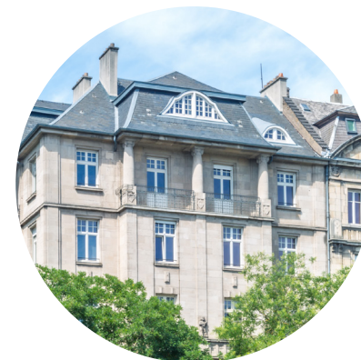
Siège social du groupe Evel 12 rue François de Curel à Metz